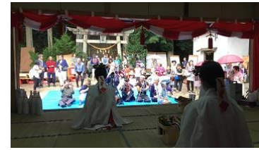
・諏訪神社祭礼／広瀬(第1土曜日)