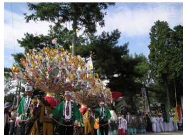
・田立花馬祭り／田立(第1日曜日)