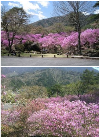
・なぎそミツバツツジ祭り ／三留野(中旬)