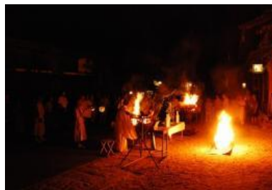
・妻籠宿火まつり／妻籠(第4土曜日)