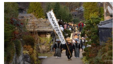
・文化文政風俗絵巻之行列 ／妻籠(23日)