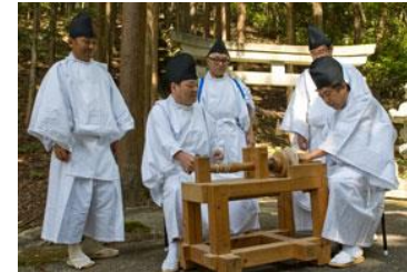
・工芸街道祭り／蘭・広瀬(上旬) ・熊野神社祭礼／十二兼(3日)