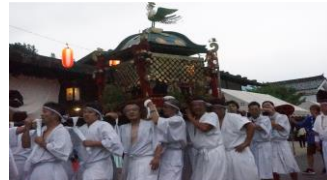
・和智野神社祭礼／妻籠(23・24日)