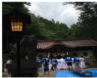
・東山神社祭礼／三留野(第3土日)