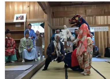
・白山神社祭礼／与川(第3日曜日)