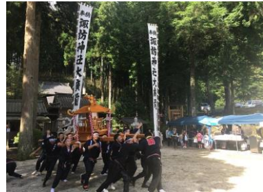
・諏訪神社祭礼／蘭(第1日曜日)