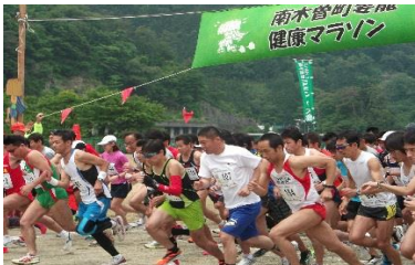
・南木曾町・妻籠健康マラソン大会 ／妻籠(第1日曜日)