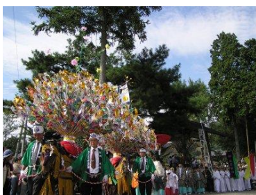
・田立花馬祭り／田立(第1日曜日)