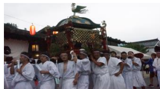
・和智野神社祭礼／妻籠(23・24日)