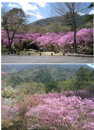
・なぎそミツバツツジ祭り ／三留野(中旬)