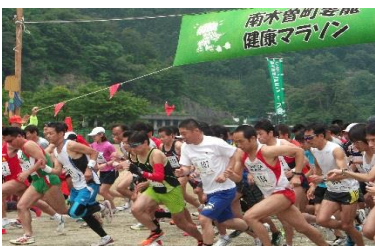
・南木曾町・妻籠健康マラソン大会