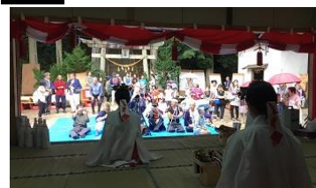
・諏訪神社祭礼／広瀬(第1土曜日)