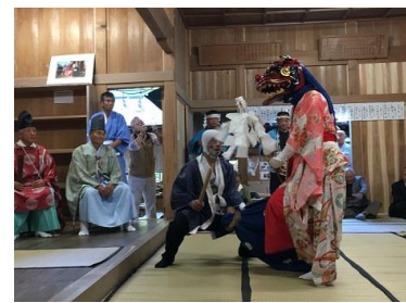
・白山神社祭礼／与川(第3日曜日)