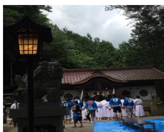
・東山神社祭礼／三留野(第3土日)