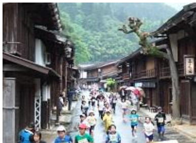
・南木曾町・妻籠健康マラソン大会 ／妻籠(第1日曜日)