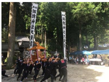
・諏訪神社祭礼／蘭(第1日曜日)