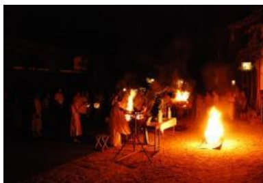
・妻籠宿火まつり／妻籠(第4土曜日)