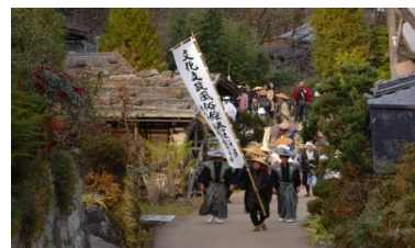
・文化文政風俗絵巻之行列 ／妻籠(23日)