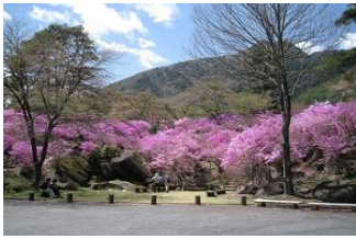
・なぎそミツバツツジ祭り ／三留野(中旬)