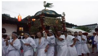
・和智野神社祭礼／妻籠(23・24日)