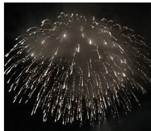
・妻籠宿火まつり／妻籠(第4土曜日)