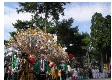
・白山神社祭礼／与川(第3日曜日)