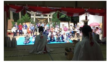
・諏訪神社祭礼／蘭(第1日曜日)