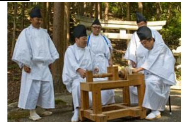
・工芸街道祭り／蘭・広瀬(上旬) ・熊野神社祭礼／十二兼(3日) ・文化文政風俗絵巻之行列 ／妻籠(23日)