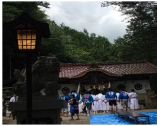
・東山神社祭礼／三留野(第3土日)