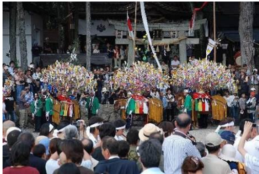
(南木曾町 田立花馬祭り)