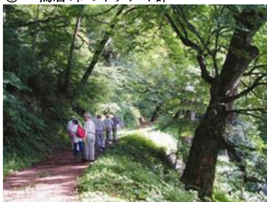
⑧ とりいとうげ 鳥居峠のトチノキ群