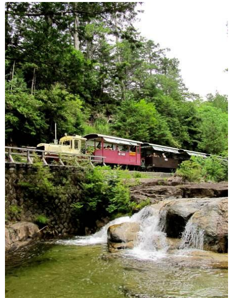
(赤沢自然休養林内)