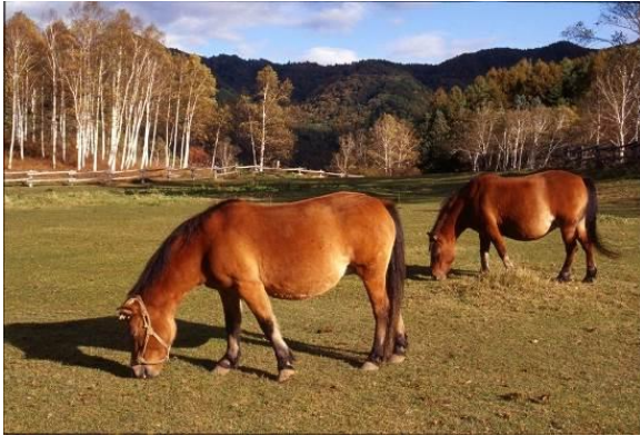
(木曾町開田高原 木曾馬の里)