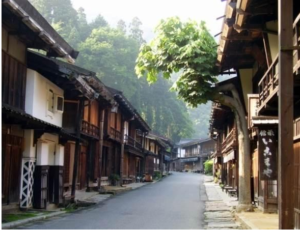
③⑩ つまごじゅく 妻籠宿 保存地区