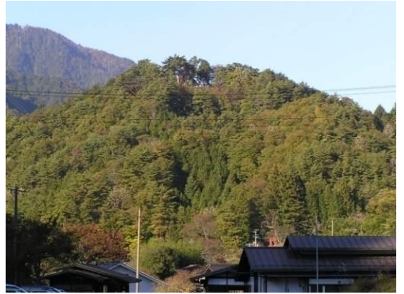
③③ つまごじょうあと 妻籠城跡