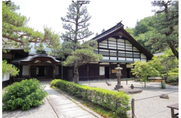
②⑧ じやうしやうじ 定勝寺