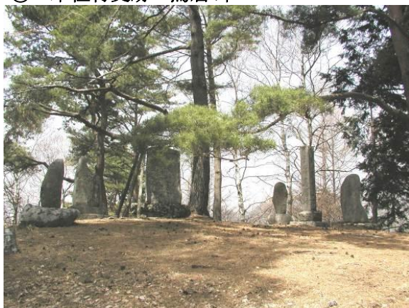
⑦ 木祖村史跡 とりいとうげ 鳥居峠