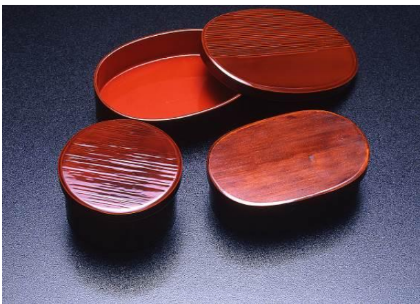
③ まげもの 曲物