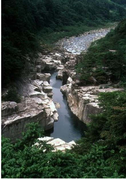
②④ ねざめ 寝覚めの床