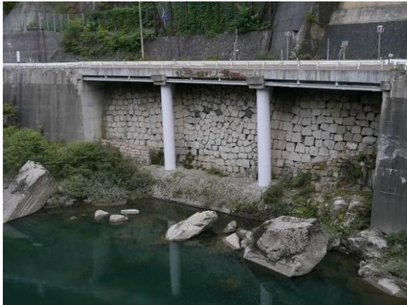
②⑤ かけはし 木曾の棧