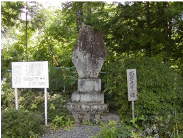
㉒ ひやくそうがんそ 百草元祖の碑