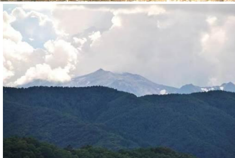
(峠から御嶽山を望む)