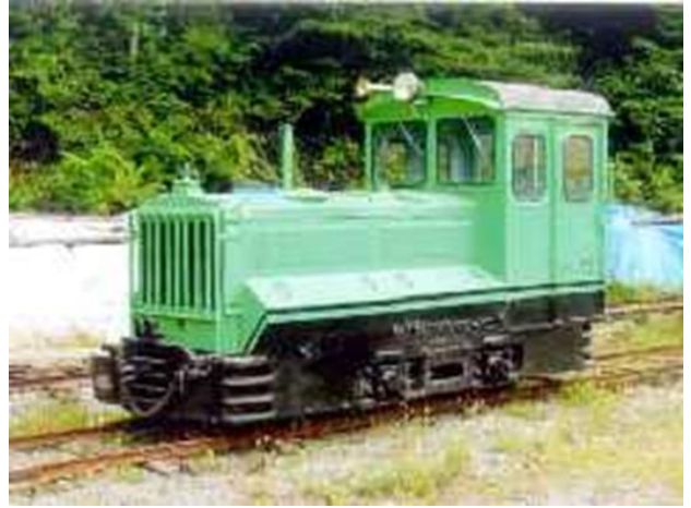
(王滝村松原スポーツ公園内)