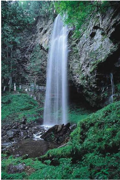
㉑ しんたき 新滝