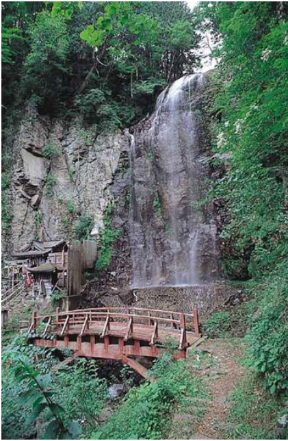
⑳ きよたき 清滝