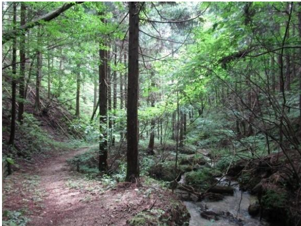
③⑫ 史跡 中山道