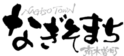
ロゴマーク基本デザイン