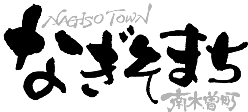
ロゴマーク基本デザイン