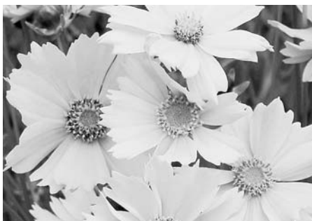
花の色は鮮やかな黄色です

南木曾町でもオオキンケイギクが見られるようになりました。オオキンケイギクは、在来の植物に影響を与えるおそれがあるので、栽培しないことはもちろん、繁殖させないよう注意しましょう。