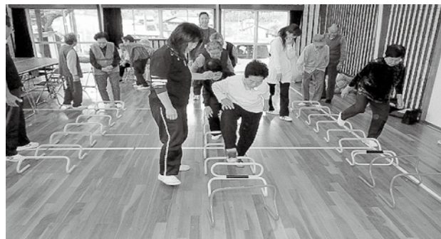
(機能訓練 運動機能訓練)