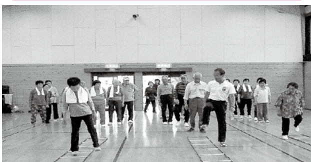
(転倒予防教室 三留野健康クラブ)