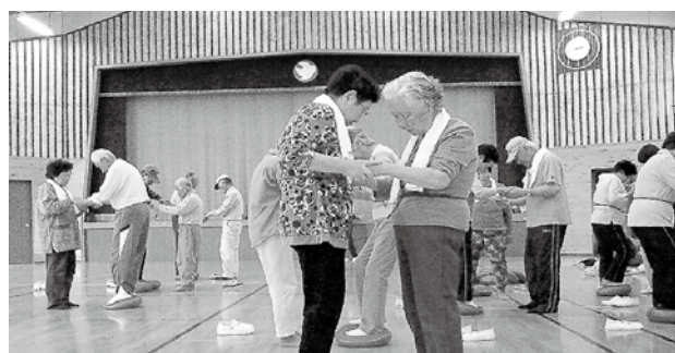
(転倒予防教室 三留野健康クラブ)