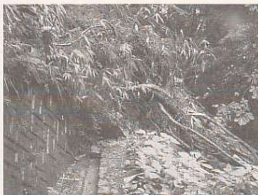
農業用水路の欠陥により土砂が崩落しました