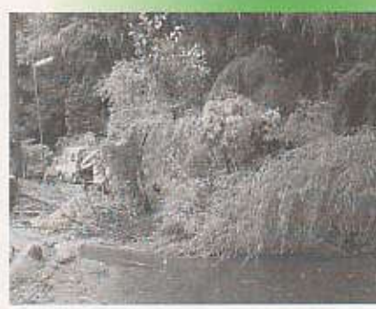
(左) 崩落した土砂が道路をふさぎました