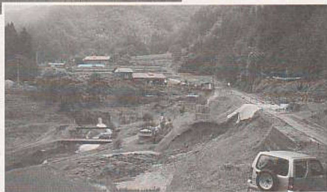
与川胡桃田地区では道路が決壊しました