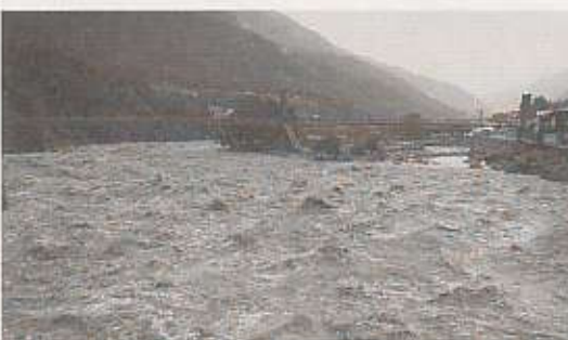
増水により木曾川に架かる橋が通行止めになりました

17日から20日までの総雨量は、一番多かった柿其地区で540ミリに達し、19日には木曾川に架かるすべての橋が通行止め、保育所・学校が休園・休校、国道19号が通行止め、JRが運休、川沿いの住民の方々に避難勧告が出されるなど、住民のみなさんの生活に大きな影響を与えました。 今後、町内各地で道路施設・農業施設・林地などの本格的な復旧作業を進めます。