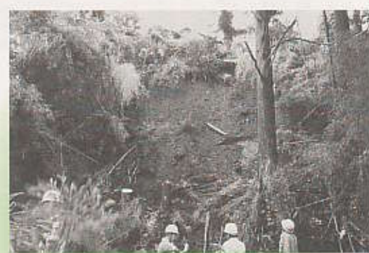
(上) 広瀬寺地区では住宅裏の法面が崩壊し、住宅が崩落するおそれがあるため、住民に避難勧告が出されています