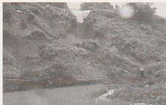
法面が崩落し、水田に土砂が流入しました