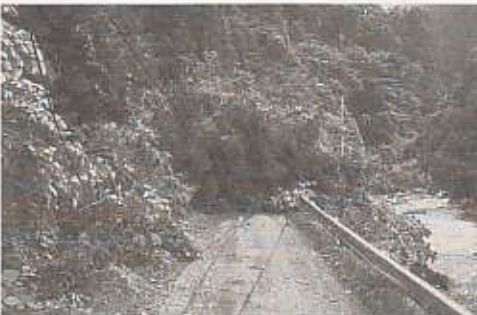
与川見沢橋下付近で土砂が崩落し、通行止めになりました

与川胡桃田地区が道路決壊により一時孤立、広瀬寺地区では住宅崩落の危機、町道上の原線で土砂崩落と道路決壊が起きるなどのほか、農業施設や林地においても大きな被害が発生しました。