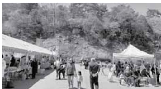
盛況の天白イベント広場