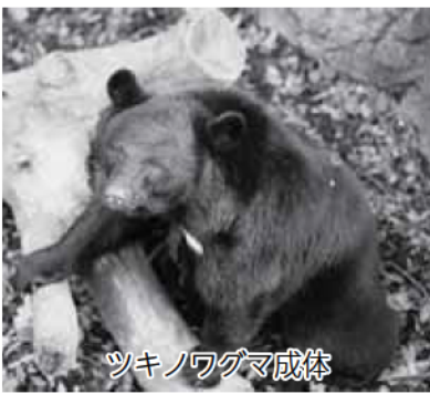
ツキノワグマ成体

ツキノワグマは、町内ほとんどの森林に生息しています。森林内に入る場合は、いっ・どこで遭遇してもおかしくないということを念頭に置き、単独で行動せず、複数人で声を掛け合いながら行動しましょう。特に朝夕の薄暗い時間帯や見通しの悪い藪の多い箇所では、不意の遭遇に十分に気を付けてください。