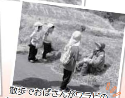
散歩でおばさんがワラビのあるところを教えてください