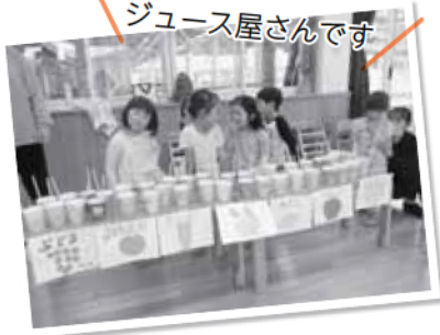
ジュース屋さんです

ひばりさんとたんぽぽさんがひよこさんの歓迎会としてピクニックごっこを計画しました。ひばりさん、たんぽぽさんが作ってくれたおかずを自分で選んでお弁当を詰めて、みんなでピクニック。「たのしい。」