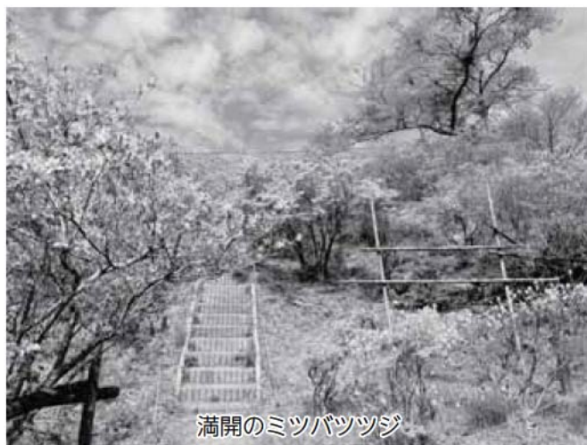
満開のミツバツツジ

今年はずっと暖かい日が続いたことから、開催初日から見頃を迎え、後半は花が散る時期となりましたが、多くの来場者にお越しいただき、大盛況のうちに終了しました。 ご協力いただいた皆様、ありがとうございました。