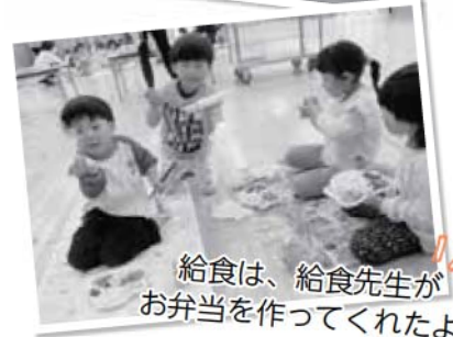
給食は、給食先生がお弁当を作ってくれたよ。