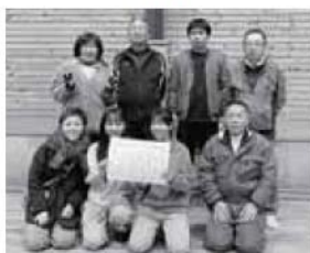
ポッチャ 準優勝 蘭C