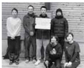
ソフトバレーボール 準優勝 田立A