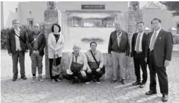
沖縄県平和祈念公園 資料館入口にて

1月13日から16日まで議員研修で沖縄県に行ってきました。この研修は議員の任期中に1度、全額自己負担で開催されてきているものです。