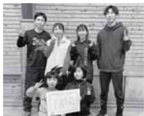
ソフトバレーボール 優勝 三留野A