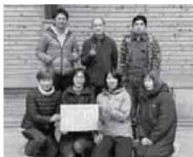
ポッチャ 優勝 与川B