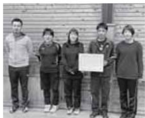
ソフトバレーボール 第3位 田立B