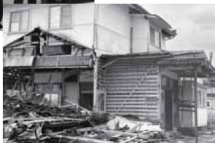
穴水町の様子