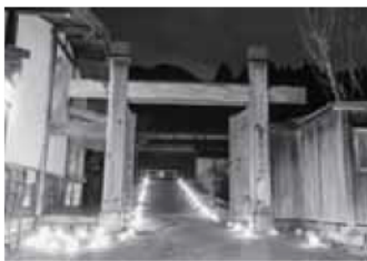
担当 南木曾氷雪の灯祭り実行委員会

皆様のご協力、ご来場誠にありがとうございました。今後とも、氷雪の灯祭りが南木曾町の冬の風物詩になるよう盛り上げていきたいと思っておりますので、皆様のご協力をよろしくお願いいたします。