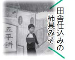
田舎仕込みの 柿其みそ