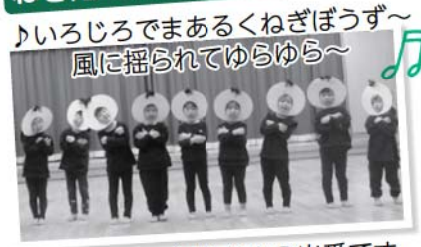
♪いろいろでまあるくねぎぼうず～ 風に揺られてゆらゆら～ 年少さんの出番です。