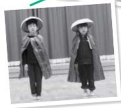
てくてくてくてく中山道。西へ東へ旅がらす～