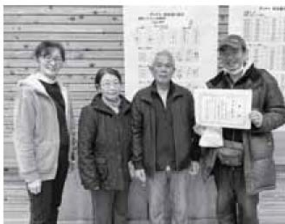
優勝：三留野 Aチーム