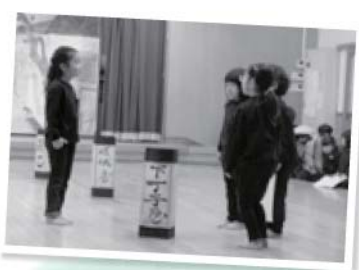
年長さんと年中さんが掛け合ってセリフを言います。