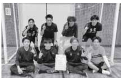
優勝：南木曽中学校OB