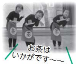
お茶はいかがです～