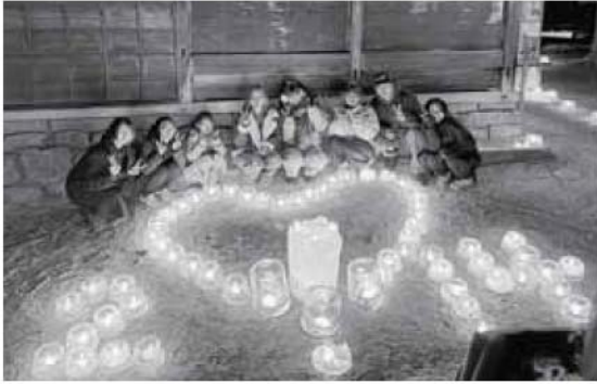
担当 元気なまちづくり係