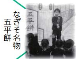
なぎそ名物 五平餅