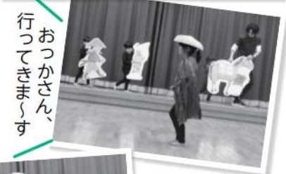
行っておつかさん、行ってきまゝす