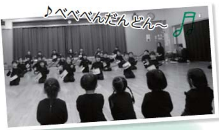
♪ベベベんだんどん♪ 年長さん、三味線をもって、浪曲風の語りを披露!

今年度最後の参観日では劇遊びをみてもらいました。今年のお話は「ねぎぼうずのあさたろう」子どもたちが大好きなお話です。みんなそれぞれの役になりきって楽しみました。