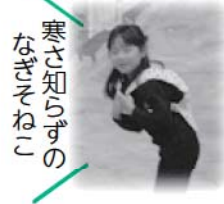
寒さ知らずの なぎそねい