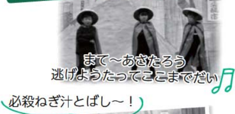
まて～あさたろう 逃げようたってここまでだい 必殺ねぎ汁とばし～!