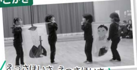
えっさほいさ、えっさほいさ、三留野宿到着～!!