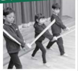
勝負はすでに じいじいる