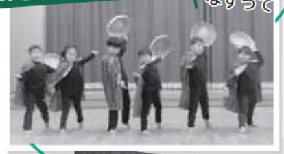
おひかえなすって