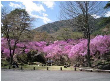
・なぎそミツバツツジ祭り ／三留野(中旬)