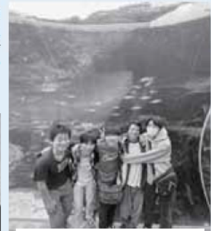
九十九島水族館きらら