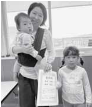
担当 健康しあわせ係

虫歯だけでなく、歯周病は他の病気の原因となる事もあります。この機会に、ぜひ三歳児親子歯科健診を受けましょう。